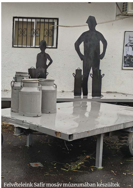
Felvételeink Saffir mosáv múzeumában készültek

(A részletet a szerző engedélyével közöljük.)