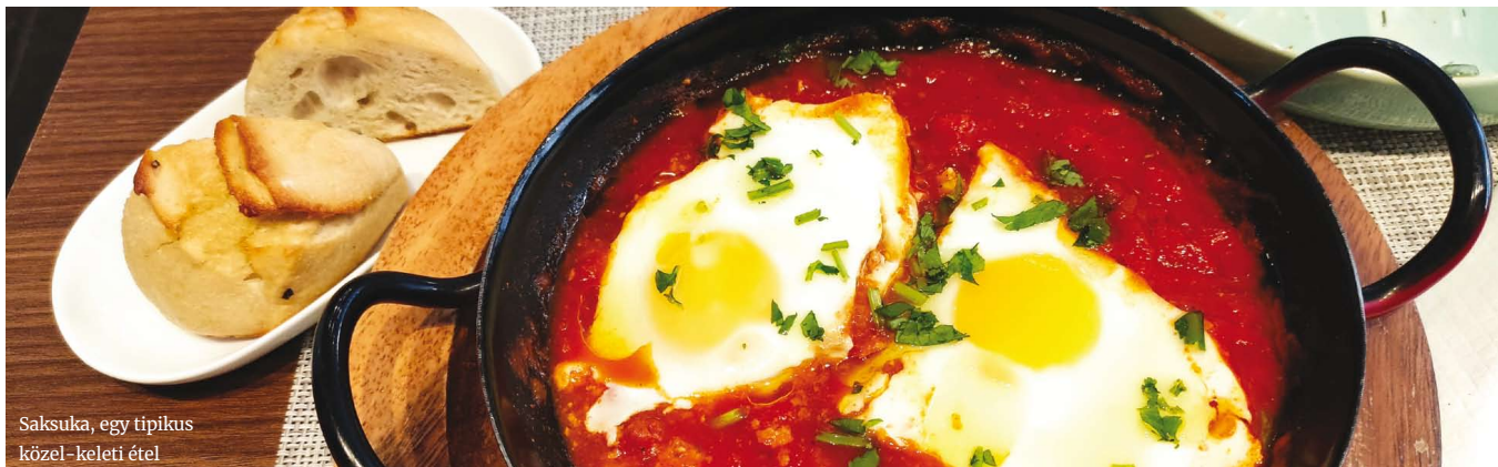
Saksuka, egy tipikus közel-keleti étel